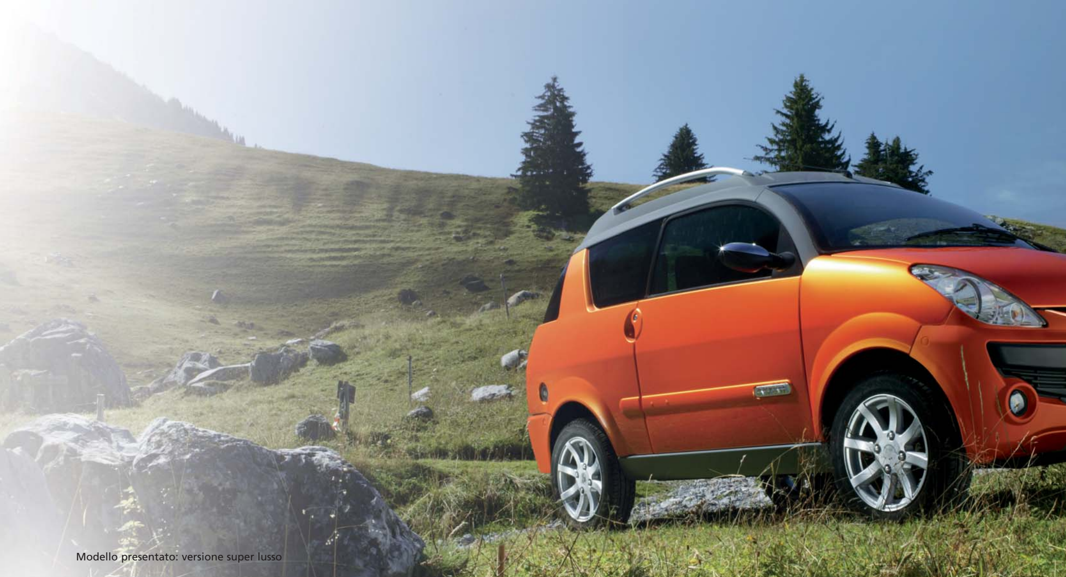
Modello presentato: versione super lusso