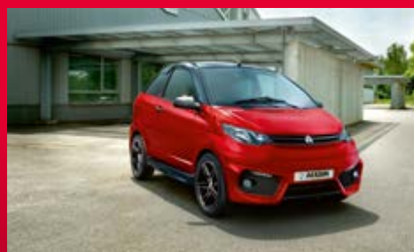
Coupé GTi pages 12 à 15