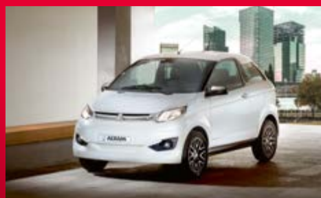
Coupé Premium pages 8 à 11