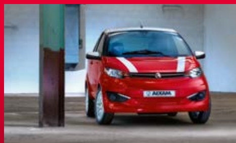
Coupé S pages 4 à 7

Les lignes sportives et précises, dessinent un volume racé, une silhouette sculptée : le design Coupé captive le regard quel que soit l'angle de vision. Chacune des finitions est profilée pour révéler une sensation de dynamisme.