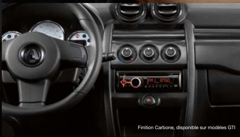
Finition Carbone, disponible sur modèles GTI

Accédez à l'innovation utile et informative.