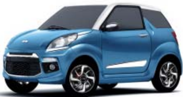
JS50 BLU AZZORRE, TETTO BIANCO