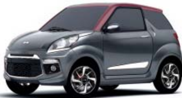
JS50 GRIGIO GRAFITE, TETTO PRUGNA