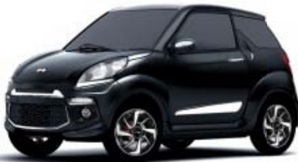
JS50 NERO, TETTO NERO

Versioni nelle foto: JS 50 versione Elegance con opzione "color line plus". Lancio gennaio 2013. Equipaggiamenti, colori e prezzi indicativi e non contrattuali, soggetti a possibili variazioni e a differenze di colore dovute alla stampa.