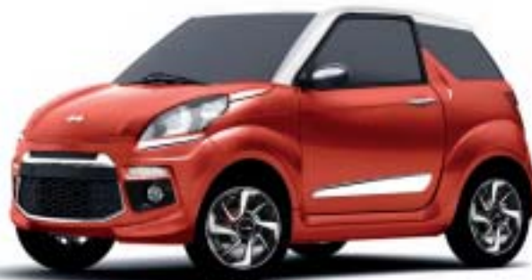
JS50 ROSSO TOLEDO, TETTO BIANCO