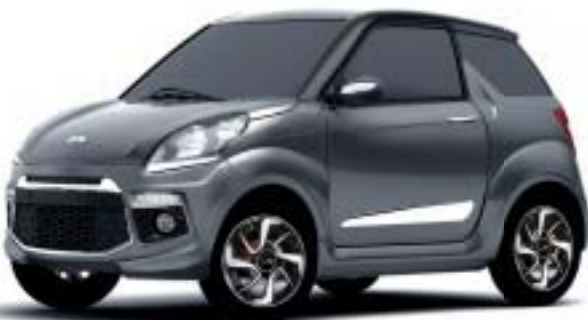
JS50 GRIGIO GRAFITE, TETTO NERO