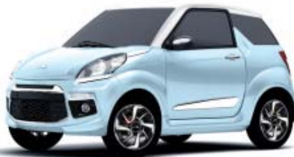
JS50 CELESTE BOTTICELLI, TETTO BIANCO