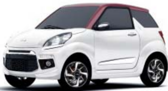
JS 50 BIANCA, TETTO PRUGNA

L'opzione "color line plus" vi permette di adattare la JS50 al vostro stile. Scegliete la versione bicolore che piú vi piace